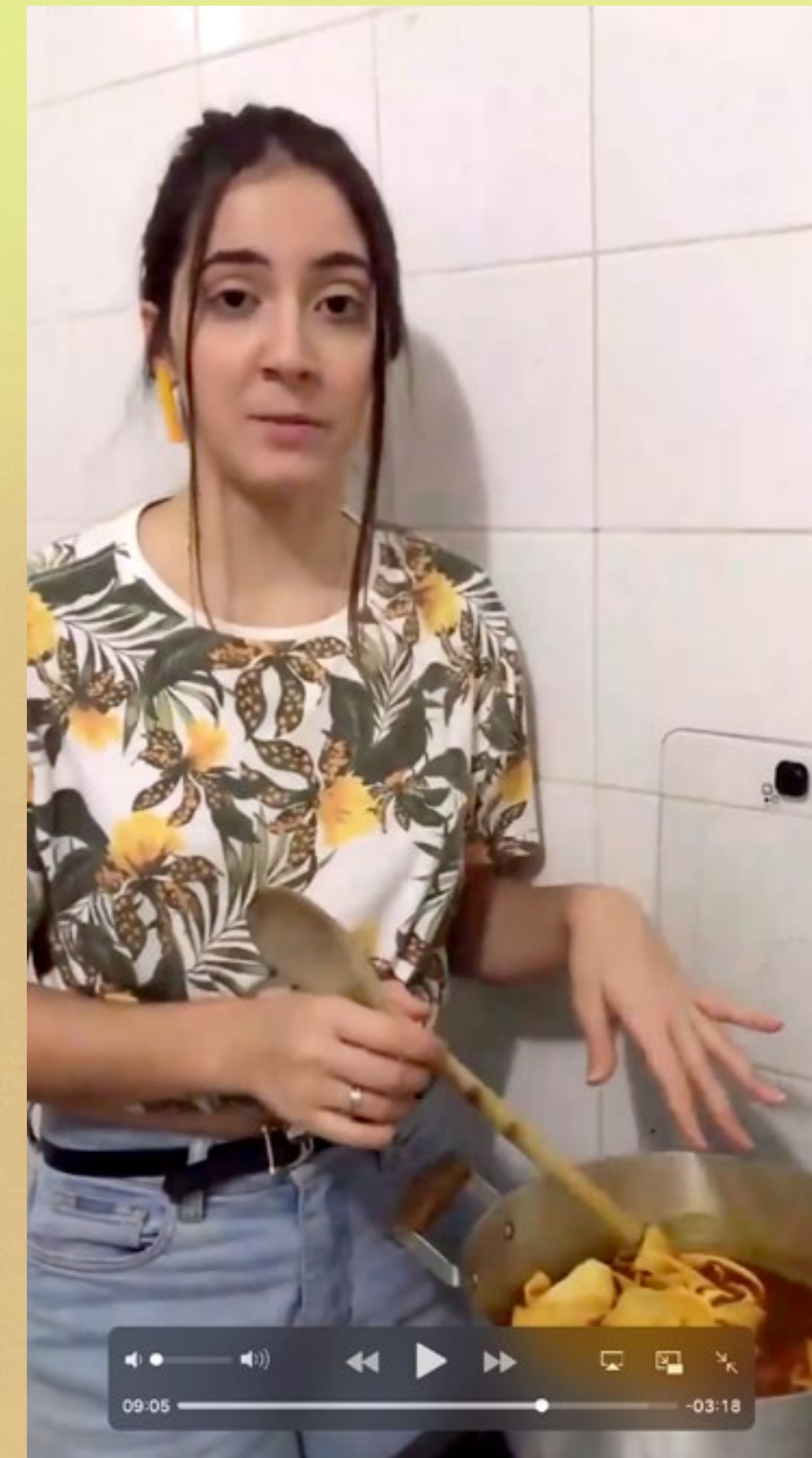
UEM - campus Cianorte