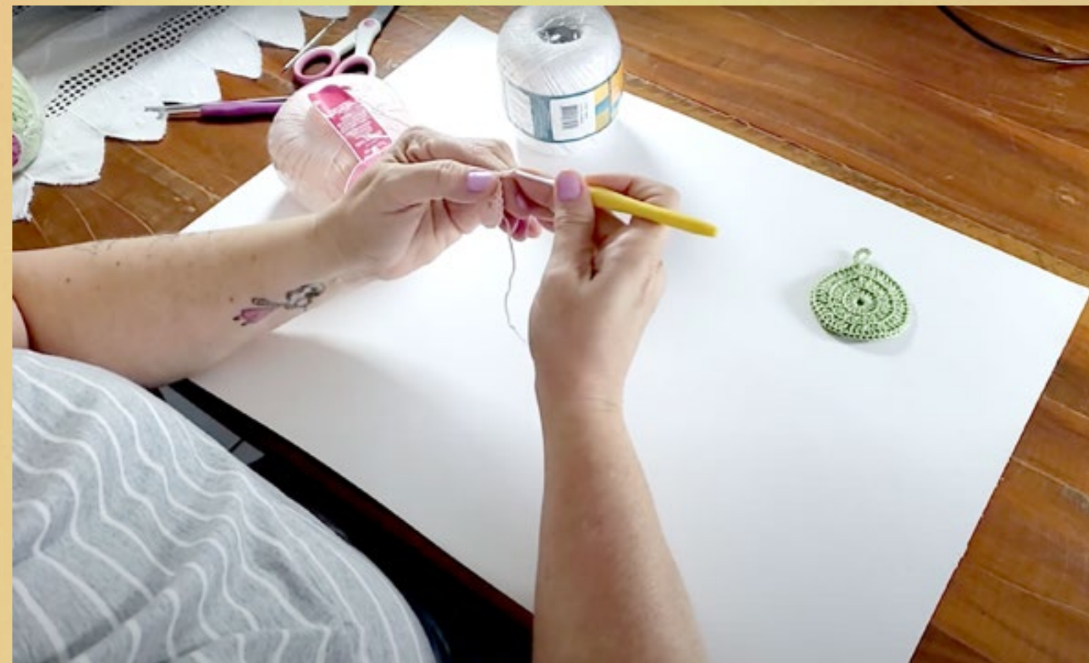
PUCPR de Curitiba

Durante a Semana Digital Fashion Revolution 2020, estudantes de todo o país aproveitaram o período de isolamento social para compartilharem tutoriais com sua rede. Entre os diversos assuntos ensinados, tivemos: bordados, crochet, tingimento natural, upcycling e reparos.