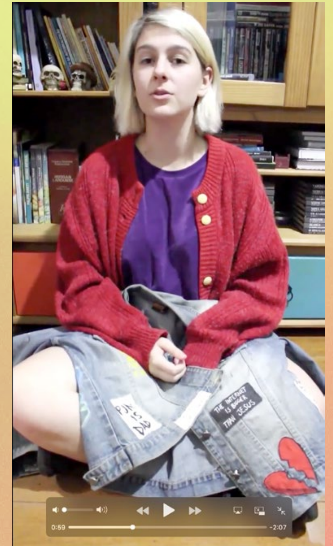
FACCAT - Faculdades Integradas de Taquara